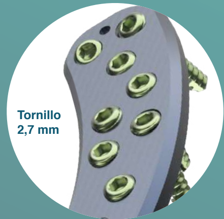
Tornillo 2,7 mm